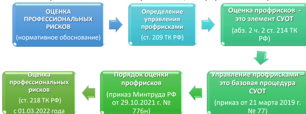
Схема нормативного обоснования проведения оценки профессиональных рисков

Для того чтобы сохранить жизни и здоровье сотрудников организации нужно выявить профессиональные риски, их оценить и внедрить управление ими.